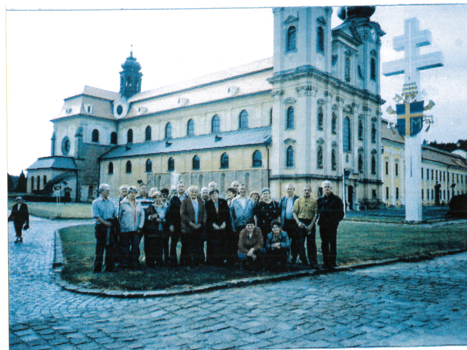
Společné foto před kostelem na Velehradě

Zájezd se všem účastníkům líbil. Všichni byli nadmíru spokojeni (jako i každoročně) skvělým vystoupením, které nás doprovázelo pěkným slunečným počasím. Na zpáteční cestě sice trochu „sprchlo“, ale nám to na dobré náladě neubralo.