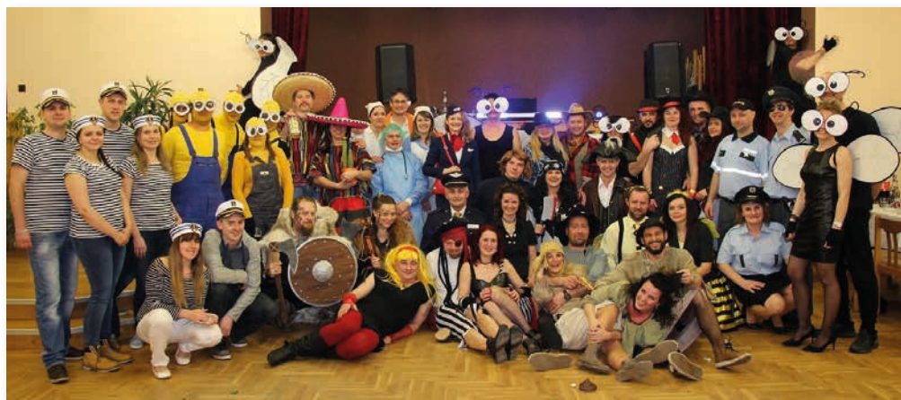
Letos došlo i na společnou fotku.