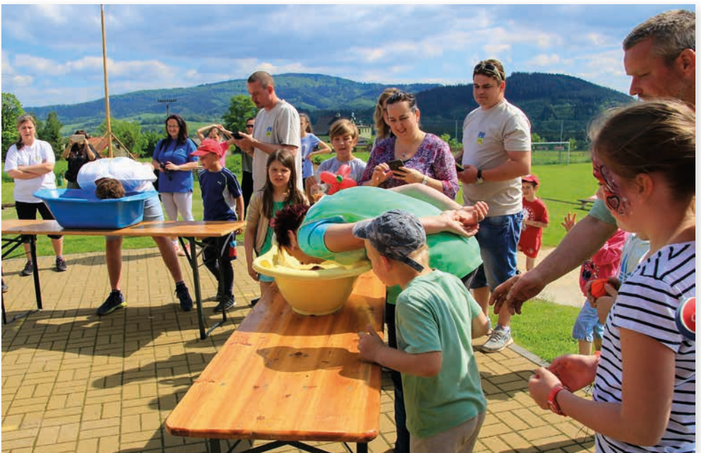
Olympiáda spolků 2017