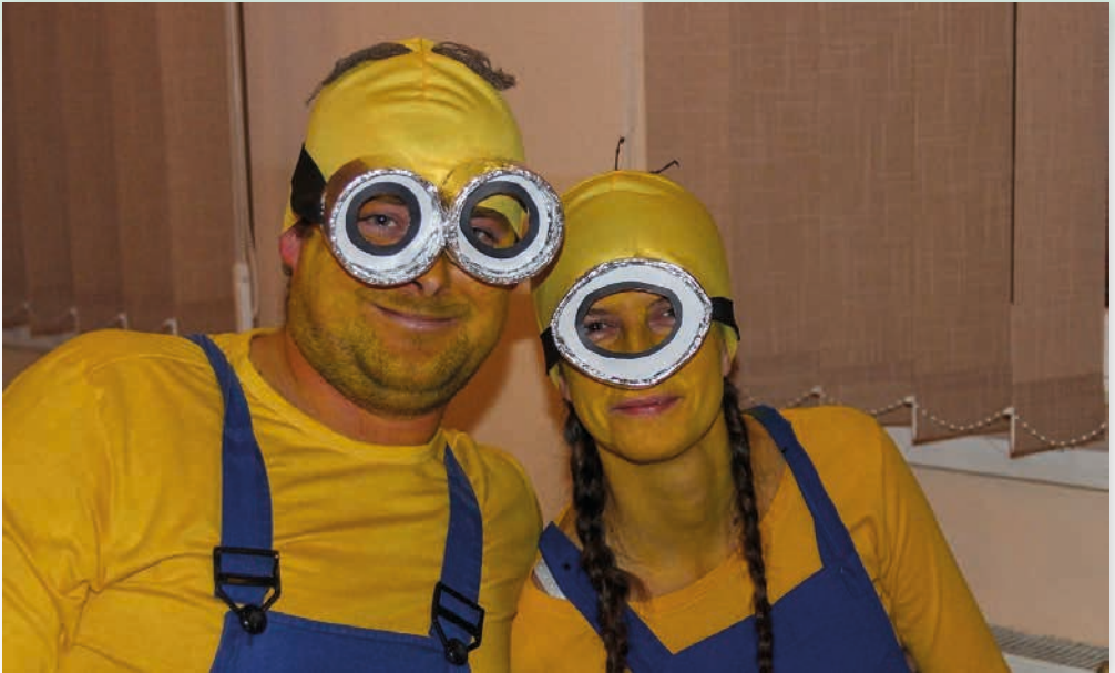
Mimoni letos zvítězili v soutěži o nejmasku.