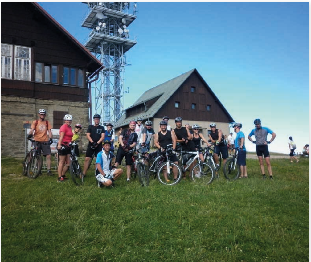
Společně na Javorovém v roce 2017

Spolek přátel kultury a sportu na Písečné z.s.