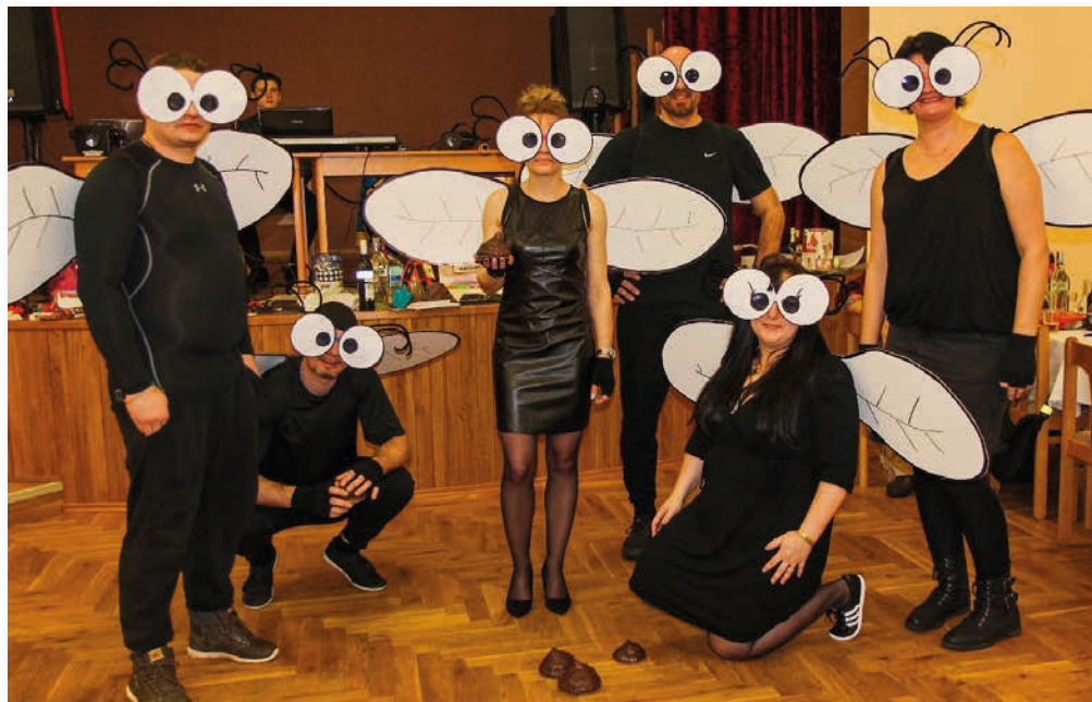
Jojo, kde je h..., tam bývají i mouchy! ☺