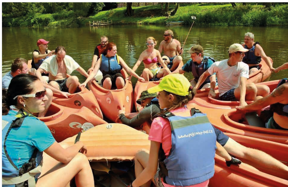
Loňské sjíždění řeky Sázavy...

Spolek přátel kultury a sportu na Písečné z.s.