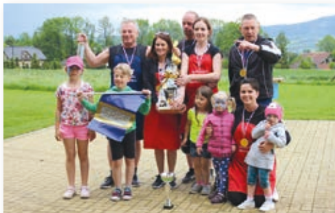
Letošní vítězové, SRPŠ Písečná