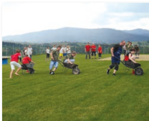
K vidění byly atraktivní soutěže

na obličej nebo skákací hrad. Povedený den byl pak zakončen večerní diskotékou.