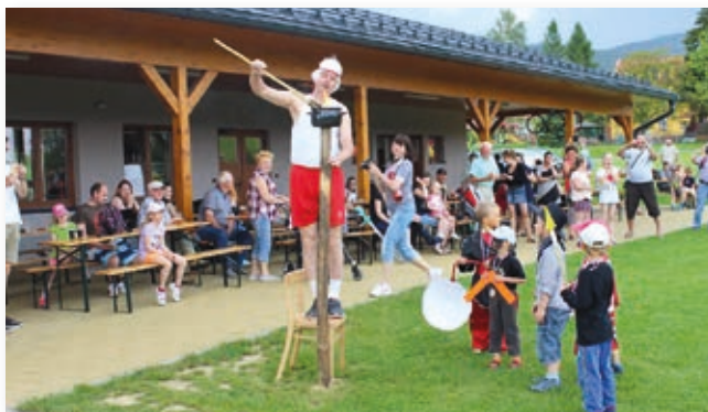
Zapálení olympijského ohně

zvítězil tým SRPŠ , těsně druzí byli PZKO , bronzovou příčku obsadili hosté z BUKOVCE , čtvrtý tým SPOLEK PŘÁTEL , pátí RYBÁŘI , šestí přátelé z PÍSKU a sedmou pozici naši HASIČI . Ovšem kdo byl na místě, ví, že opravdovým vítězem byla dobrá nálada a bouřlivá divácká podpora, která nás celou olympiádou provázela. Na své si přišli samozřejmě i děti, které si užily třeba vystoupení klaunů, malování