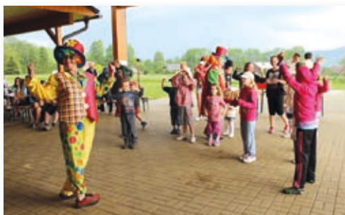
Klauni byli suproví