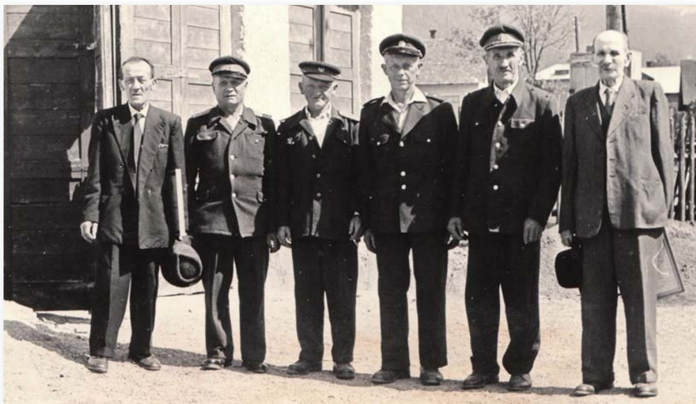
Rok 1966 – 40. výročí založení sboru – foto před přestavěnou zbrojnicí

Mezi léty 1964 až 1966 došlo k přestavbě původní, již nevyhovující zbrojnice. Přestavba se prováděla brigádně vlastními silami.