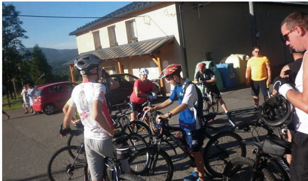
Před výjezdem od kulturního domu