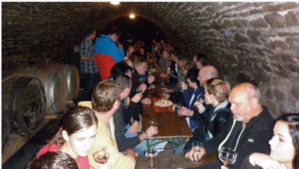
Posezení při degustaci...