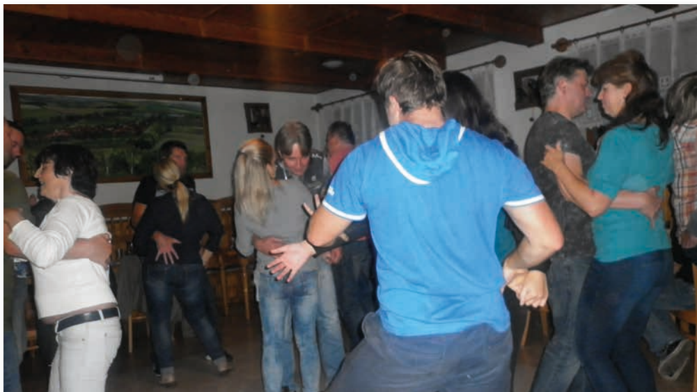
Tančilo se a zpívalo až do rána 😊