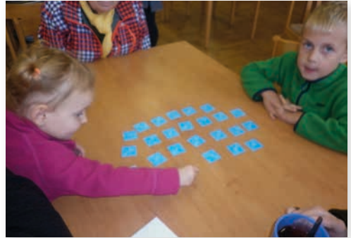
Vskutku napínavé Pexeso :D