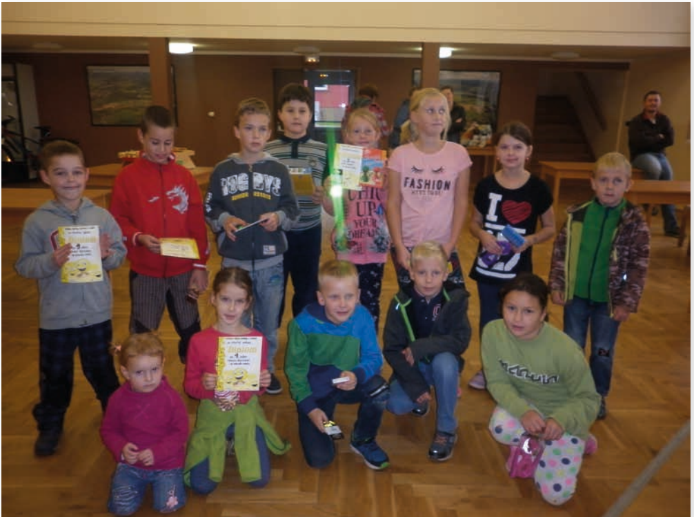
Všichni malí soutěžící. Kdo přišel, nelitoval!!!