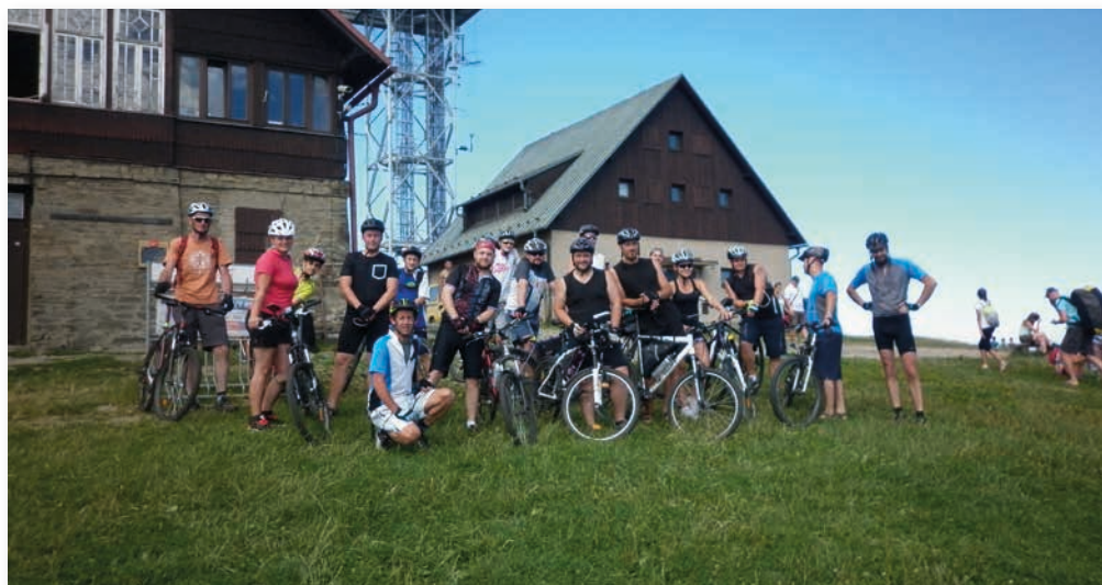
Všichni společně na Javorovém u chaty