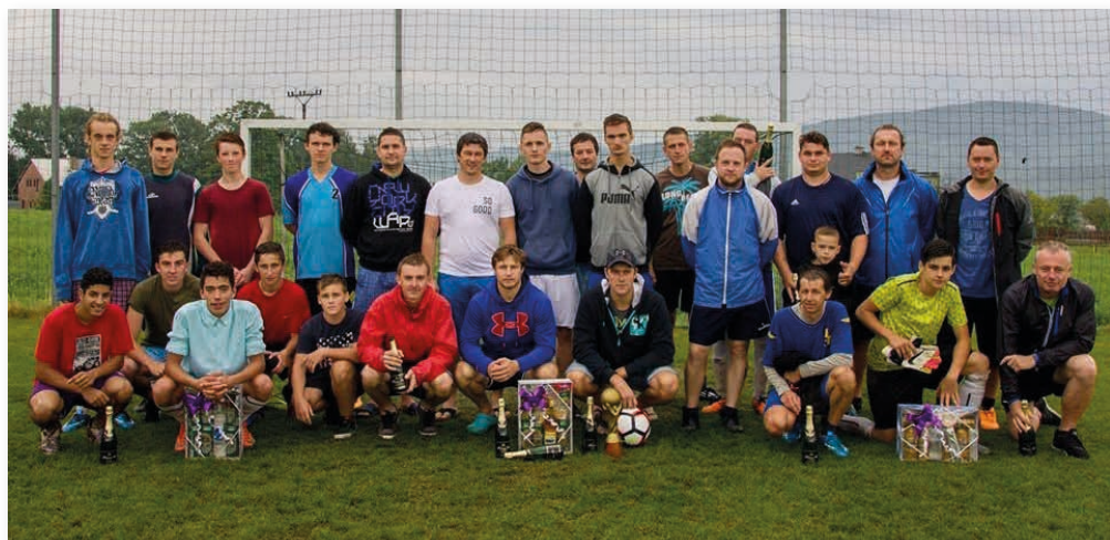
Společné foto všech účastníků turnaje