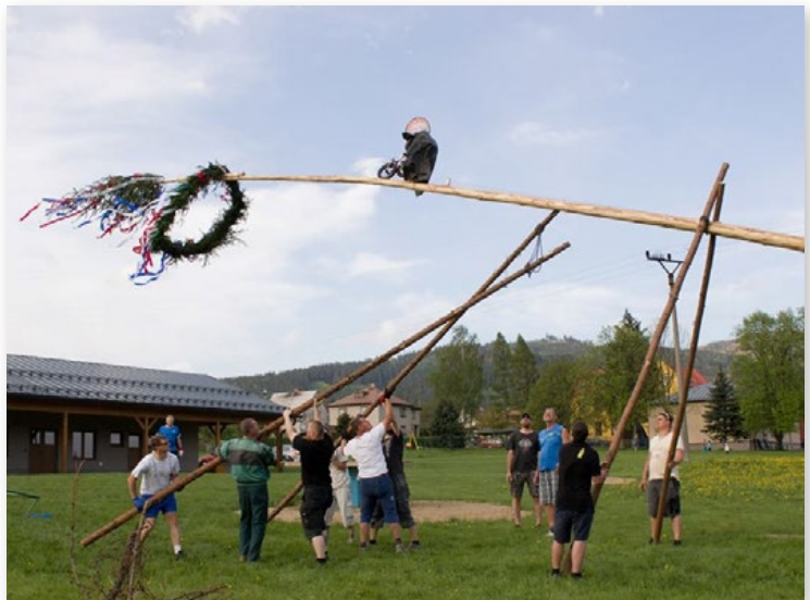
V loni nám dal Máj opravdu zabrat, naštěstí se nás sešlo dostatek. Co letos, přijdete?

Další akcí, kterou pořádáme, je Stavění máje, konanou 30. dubna v areálu Výletišť. Akce bude mít podobný průběh jako loni, nebude chybět společné postavení a ozdobení máje, pálení čarodějnice, smažení vaječiny, opékání klobásek, nějaké to občerstvení a nebude chybět ani pívko. Začátek akce bude v 15:00. Kdo má zájem a chuť poseďte s přáteli ať dorazí a pomůže nám ho postavit ☺.