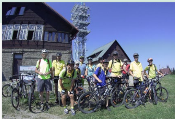
Společné foto z Javorového vrchu je nedílnou součástí každé Tůr de Gorol.