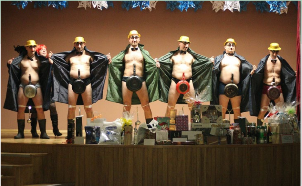
Tradiční aplaus sklidilo nově nacvičené představení skupiny „Vylíž kýbl“