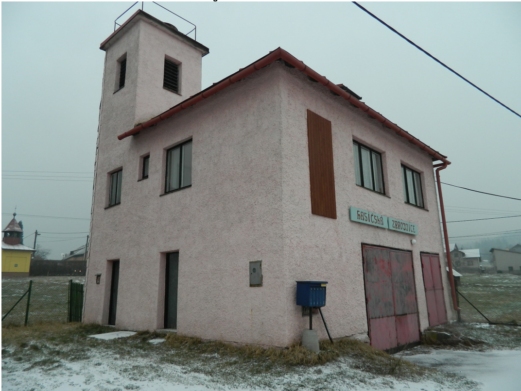
Fotodokumentace hasičské zbrojnice: